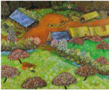
094. LES HOMMAGES DE MAI

Cette œuvre est une œuvre de l'artiste. Elle est destinée à être vendue au profit de l'association. Elle est destinée à être vendue au profit de l'association. Elle est destinée à être vendue au profit de l'association.